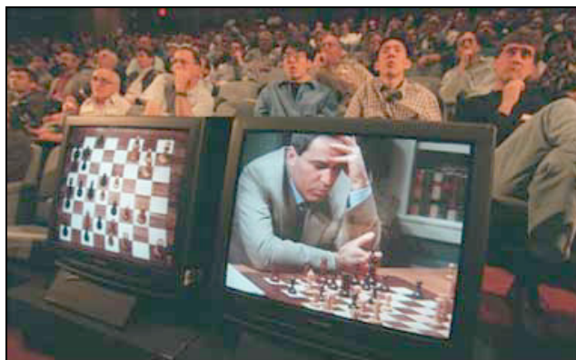
Рис. 1.3. Гарри Каспаров в решающем матче с DeepBlue

Интересно было группе способных студентов пробовать свои силы, да и тема диплома была отличная. После создания DeepThought группу разработчиков заметил маркетинговый департамент фирмы IBM и обратился к ней с предложением. Результатом стали DeepBlue и DeepBlue2. Таким образом, DeepBlue — это результат более чем десятилетней работы очень способной группы студентов, при поддержке гроссмейстеров и миллионов IBM. Эта машина, помимо специализированного компьютерного железа, использовала распараллеливание alpha-beta перебора.