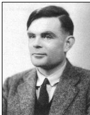
Рис. 1.2. Алан Тьюринг (1912—1954)

В 1951 году Алан Тьюринг (рис. 1.2) написал алгоритм, при помощи которого машина могла бы играть в шахматы. Только в роли машины выступал сам изобретатель. Этот нонсенс даже получил название — "бумажная машина Тьюринга". Автору требовалось более получаса, чтобы сделать один ход. Алгоритм был довольно условный, и сохранилась даже запись партии, где "бумажная машина" Тьюринга проиграла одному из его коллег.